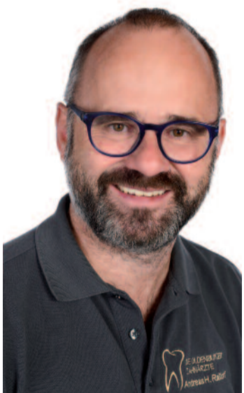
Von Andreas H. Rassloff, die-oldenburger-zahnärzte, Juventis Tagesklinik

Zahnarztbesuch ohne Angst und Ausfallzeiten